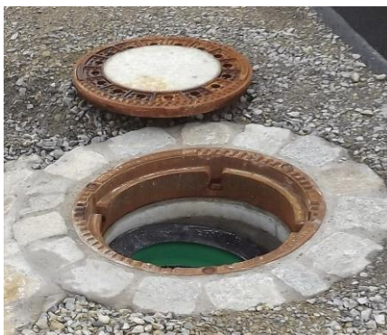
Beispiel: SR-Systemabschluss am Steigrohr DU 600 (DN 500) Betonring 625 mm