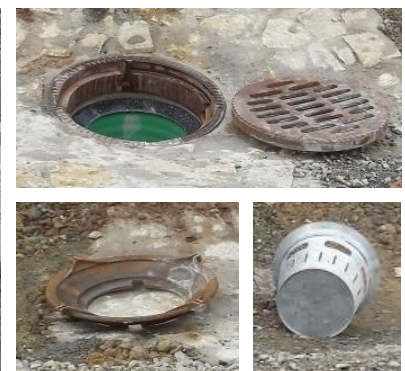
Trichtereinsatz mit Schmutzfänger schmal

Hinweis: Die Bauhöhe der OK Abdeckung ergibt sich aus dem Aufbau der Tragschicht, Betonfundament, Betonausgleichsring und Abdeckrahmen. Das Abstandsmaß OK Steigrohr zur UK Abdeckrahmen muss mit \geq 4 cm eingehalten werden. Der Einbau Schmutzfänger ist zu beachten.